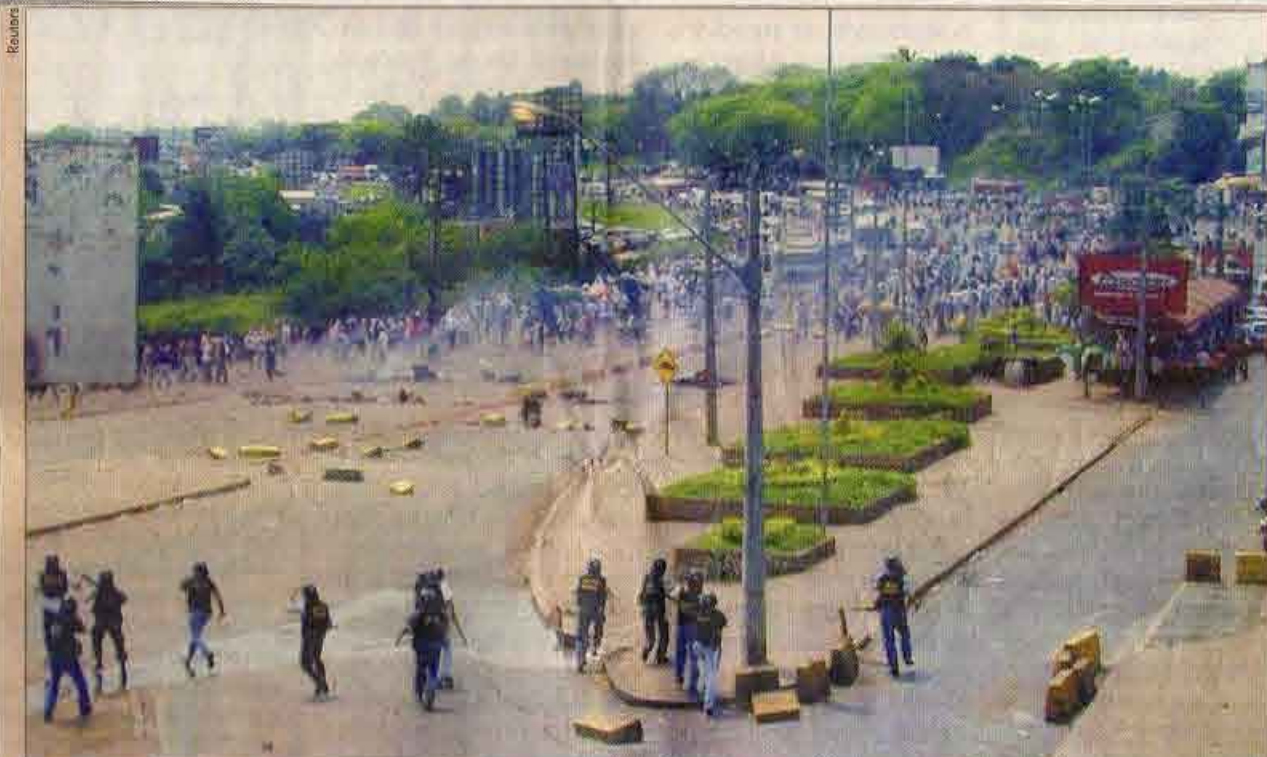
TUMULTO NA FRONTEIRA - A Polícia Federal usou balas de borracha e bombas de gás lacrimogêneo para conter cerca de 2.000 sacoleiros, na manhã de ontem, na Ponte da Amizade, que liga o Brasil ao Paraguai. O tumulto começou depois que a Receita Federal apreendeu 20 veículos com contrabando. Instalações da Receita Federal e carros foram depredados por sacoleiros. Só às 12 h tudo acabou.