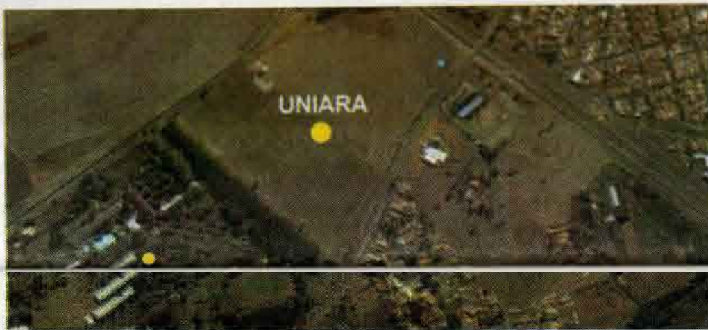
Área adquirida soma-se ao terreno que a Uniara já possuía no local, totalizando 240 mil metros quadrados

Com intermediação da Chalu Imóveis, o Centro Universitário Araraquara (Uniara) comprou área de 118 mil metros quadrados, ao lado do campus da Unesp. A conquista marca o início do processo de expansão da instituição privada de ensino que mais cresce na região